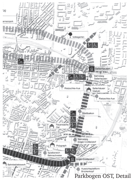
Parkbogen OST, Detail