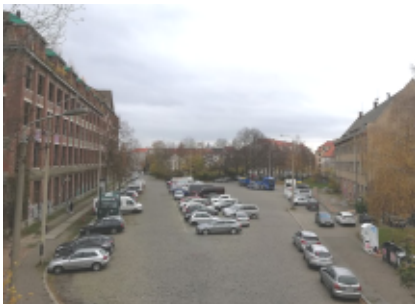
Parkplatz zwischen Ostwache und Polygraph

Was bedeuten die Zahlen konkret? Es sei dem Investor eine Abschreibung über zehn Jahre gegönnt. Teilt man den Investitionszuschuss der Stadt durch 120 Monate und noch einmal durch die 70 Stellplätze ergibt sich eine Stellplatzmiete von knapp 200 Euro pro Monat. Wer will das in Anger-Crottendorf zahlen? In Schleußig wollte das niemand.