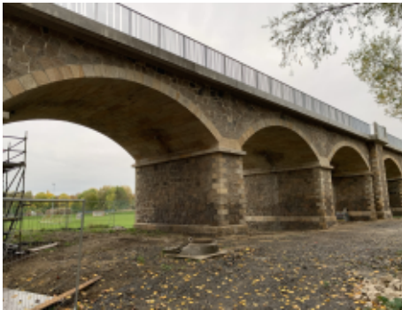
Sanierungsarbeiten am Viadukt sind abgeschlossen.

Nach Stilllegung der alten Bahnstrecke im Zuge der Vorbereitung und Inbetriebnahme des Leipziger City-Tunnels fiel dieser Bahndamm in einen Dornröschenschlaf, die Stromleitungen und Masten wurden schnell (oder bei den Masten etwas langsamer) abgebaut und auch die Schienen verschwanden irgendwann. Seitdem konnte sich auf dem Damm die Natur frei entwickeln, es wuchsen Sträucher und teilweise Bäume. Von den Menschen, die in Anger-Crottendorf leben oder die den Stadtteil besuchen wurde er seitdem nur noch zum Spaziergehen (obwohl es keine wirklich offizielle Freigabe dafür gibt) genutzt.