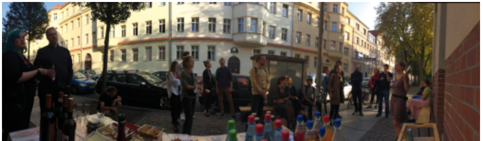
Ausstellungseröffnung am 17.09.2020