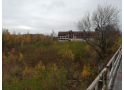
Brachfläche hinter der Polygraph-Ruine

Der größte Teil des Gebäudebestandes auf dem Gelände zwischen Zweinaundorfer,- Theprdor-Neubauer-Straße und Parkbogen wurde 1994/95 abgerissen. Für den Bereich wurde 1994 der Bebauungsplan Nr. 102 „Crottendorfer Plan“ aufgestellt und in Teilen 1996 überplant, um eine Aktivierung der Flächen in Form von Geschosswohnungsbau sowie am östlichen Planrand, auch zur Abschirmung gegenüber der ehemaligen Bahntrasse, in Form einer gemischten Nutzung vorzunehmen. Diese Nutzungs- und Bebauungsabsichten wurden bis jetzt, obwohl die Planung heute wieder geeignet ist, ein zeitgemäßes, verdichtetes Stadtquartier zu entwickeln, nicht umgesetzt. Lediglich die ehemaligen Fabrikantengebäude im westlichen Teil des Plangebietes wurden saniert und danach neu wohn genutzt.