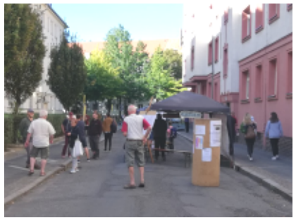
Impressionen vom Park(ing) Day

So trafen sich Anwohnende und plauderten miteinander. Passieren schleckten ein Eis und liefen auf den Gehwegen nebeneinander statt hintereinander. Die Postboten grüßten freundlich und freuten sich über den großzügigen Bewegungsraum. Kinder spielten wie selbstverständlich mit dem Straßenspielzeug und die Erwachsenen aßen ein Stück Kuchen vom Brause-Bäcker und genossen ein Tässchen fair gehandelten Kaffee, während Wo ist Martin den musikalischen Rahmen bot.