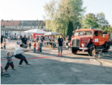
Sommerfest in der Ostwache

So hieß das Sommerprogramm, was die Ostwache dieses Jahr auf die Beine gestellt hat. In der anhaltenden Warteposition auf einen positiven Stadtratsbeschluss und einen Vertrag für das ganze Gelände wollen wir nicht verharren, sondern der Nachbarschaft einen Vorgeschmack bieten, auf das was eines Tages sein wird. So haben wir ein breites Programm für möglichst verschiedene Altersgruppen überlegt und umgesetzt. Es gab einen Graffiti-Workshop, der den vier Toren an der Ostwache ein neues Design verpasst hat, ein Sommerfest vor der Tischlerei mit Live-Musik und Kinderprogramm, einen Stencil Workshop und natürlich das Herbstfest.