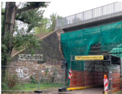
Sanierungsarbeiten an den Brücken geht weiter

In den kommenden Jahren werden die Steinbogenbrücken im Kleingartenpark saniert. Der erste Abschnitt des Geh- und Radweges, inklusive Rampen und Treppen, wird von der Eisenbahnstraße über das Viadukt bis zur verlängerten Bernhardstraße (Vereinsheim Immergrün) umgesetzt. Die weiteren Abschnitte bis zur Anger-Crottendorfer Bahnschneise folgen dann nach und nach (als erstes der Bereich zwischen der Theodor-Neubauer-Straße und der Zweinaundorfer Straße). Mehrere