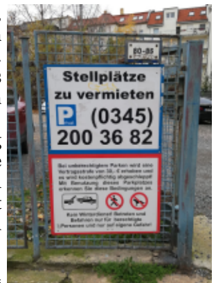
Stellplatzmarkt in Scheußlich

Anfang der Zehnerjahre taten sich dort Anwohnende, Stadtverwaltung und ein Investor zusammen. Ziel war es, ein zu bebauendes Grundstück um eine Quartiersgarage (bzw. eine weitere Tiefgaragenebene) zu erweitern, sodass Anwohnende des Viertels dort ihr Fahrzeug abstellen können und eben nicht mehr die Gehwege besparen. Nach mehreren Workshops mit Bürger*innenbeteiligung wurde der Bebauungsplan Nr. 415 "Quartiersgarage Rochlitzstraße" (Vorlage – VI-DS-01631) allerdings am 16.12.2015 von der Ratsversammlung aufgehoben. Heute ist das Grundstück immer noch nicht bebaut, aber man kann dort einen Stellplatz mieten. Was war passiert?