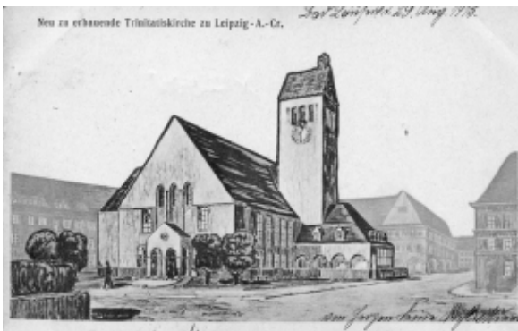
Neu zu erbauende Trinitatiskirche zu Anger-Crottendorf. Heute steht an dieser Stelle der Konsum.

In einem Zeitungsartikel vom 21.04.1934 gehen über den weiteren Verlauf folgende Informationen hervor. Es lag zu diesem Zeitpunkt eine Zusage des Landeskirchenamtes für die Erbauung der neuen Kirche vor und als Architekt wurde Georg Staufert gewonnen. Das geplante Aussehen der Kirche ist auf dem abgebildeten Modell ersichtlich. Das Projekt sah ein Kirchengebäude mit breitem Frontturm, eine Feierkirche und ein Gemeindehaus vor. Die Turmwand sollte eine Höhe von 24 Meter haben und darüber ein 7 Meter hohes Turmkreuz stehen. Der Kirchenraum sollte mit seiner Erweiterung 1.100 Sitzplätze umfassen und die Feierkirche sollte 250 Plätze haben. Neben dem Gemeindesaal sollte das Gemeindehaus auch über 3 Wohnungen in 2 Etagen verfügen.