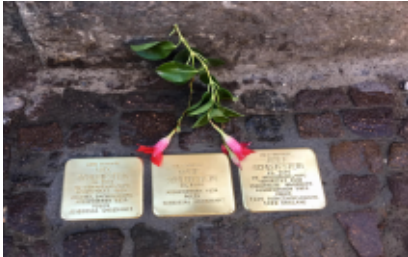
Stolpersteine in der Zweinaundorfer Straße der Familie Schleifstein

Auch in diesem Jahr riefen der Erich-Zeigner-Haus e.V., VVN-BdA Leipzig und weitere Initiativen am 9. November zum bereits 13. Mal zur gemeinsamen Gedenkaktion „Mahnwache und Stolpersteine Putzen“ auf, die in diesem Jahr Corona-bedingt ohne das offizielle, städtische Gedenken in der Innenstadt am Synagogendenkmal in der Gottschedstraße stattfand.